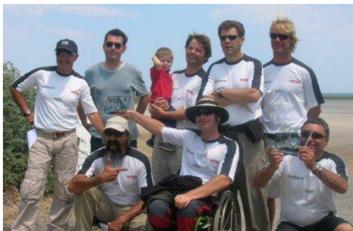
Primer equipo de competición de la A.B.B. en el "Open de France 2007"

El primer equipo de competición nace en Mallorca, al mismo tiempo que la Associació Balear de Blokart en el 2007, con los pilotos que se han ido agregando a esta nueva modalidad, acumulando victorias y trofeos en todos los eventos deportivos a los que les ha sido posible asistir alrededor del mundo (Francia, Bélgica, Holanda, Dinamarca, Reino Unido, U.S.A., Nueva Zelanda, España). Actualmente son los Campeones del Mundo en dos categorías de peso de la clase Producción y Campeones de Europa en otras dos categorías.