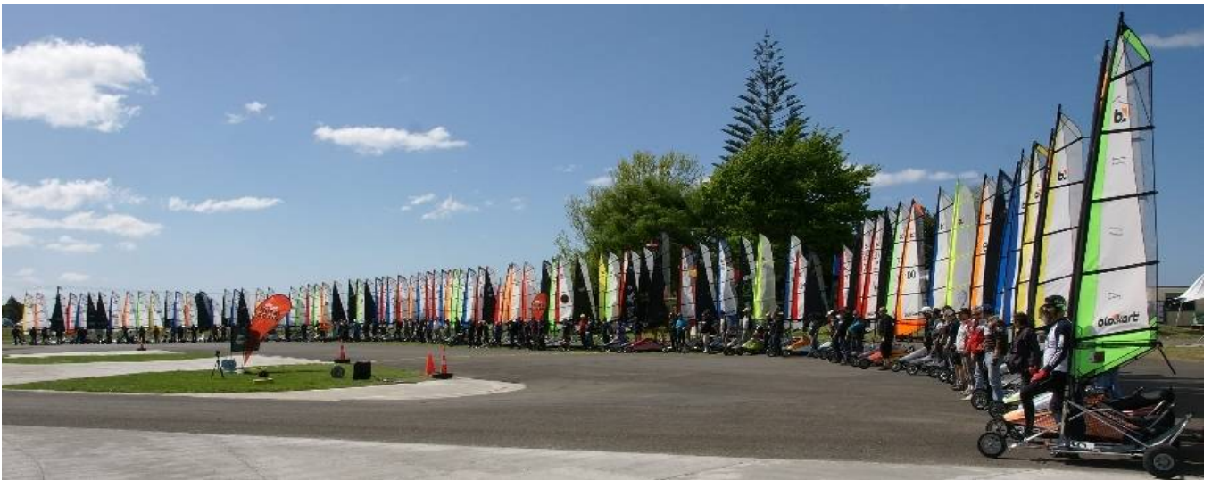
“Kellogg’s Nutri-Grain World Championship 2008”, Papamoa (NZ)

Sus particulares características le han permitido desarrollarse en países sin ninguna tradición previa en carrovelismo, celebrando el pasado 2008 la primera edición del Campeonato del Mundo de esta clase monotipo, convirtiéndose en el equivalente terrestre de las clases náuticas Optimist o Laser.