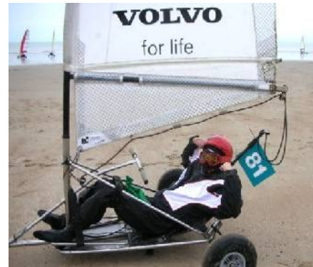
Marieke Vervoort (BEL, Ataxia de Friedreich) En su participación en el “Belgian Open 2009” y “Campeonato de Europa 2009”, Romo, Dinamarca.

Sordera, amputación de un miembro inferior o dos, amputación de un miembro superior, polio, paraplejia, tetraplejia, parálisis cerebral, distrofia muscular, osteogénesis imperfecta, hepatitis-c, HIV... no son impedimento para la práctica lúdica y deportiva de blokart, todos somos competidores y compañeros.